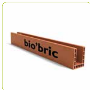
6 Linteaux grandes longueurs