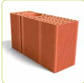
2 Poteau multiangle