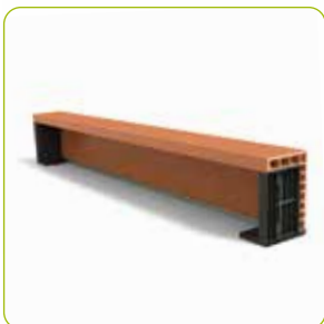
5 Coffres de volets roulants